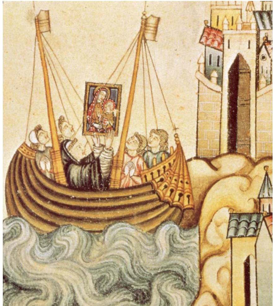
Peregrinos a Santiago por mar, protegidos por la Virgen. Scriptorium real de Alfonso X el Sabio. Biblioteca del Real Monasterio de San Lorenzo del Escorial