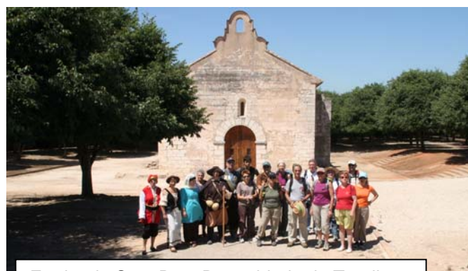
Ermita de Sant Roc. Despoblado de Ternils.